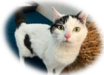
Sweet 15 ans

Ses dernières semaines beaucoup de chats âgés sont arrivés au refuge, Copette une chatte de 10 ans aveugle, Zanyi une minette de 15 ans, Huapi qui elle a 16 ans. Nous sommes toujours impressionnés du courage que ses animaux âgés ont, en arrivant au refuge. Pensez à nos séniors pour les adoptions, se sont des chats incroyablement reconnaissants de tout l'amour qu'ils reçoivent.